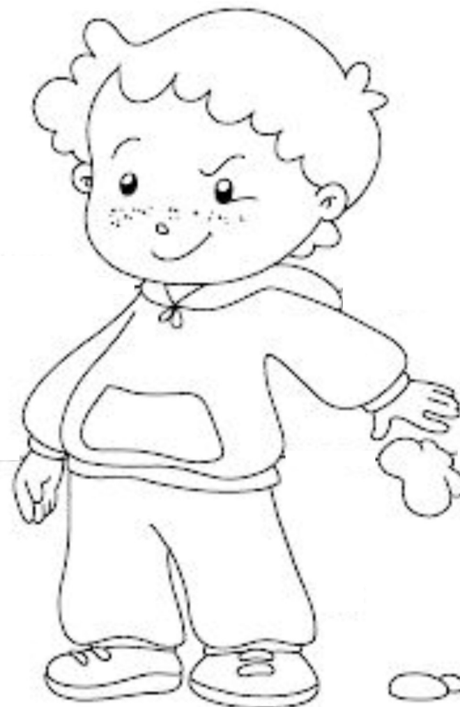
BAMBINO CHE BUTTA LA CARTA PER TERRA

ATTIVITA': INDIVIDUA L'AZIONE CORRETTA TRA QUELLE CHE VEDI NEL DISEGNO E MOTIVA LA TUA SCELTA . COLORA