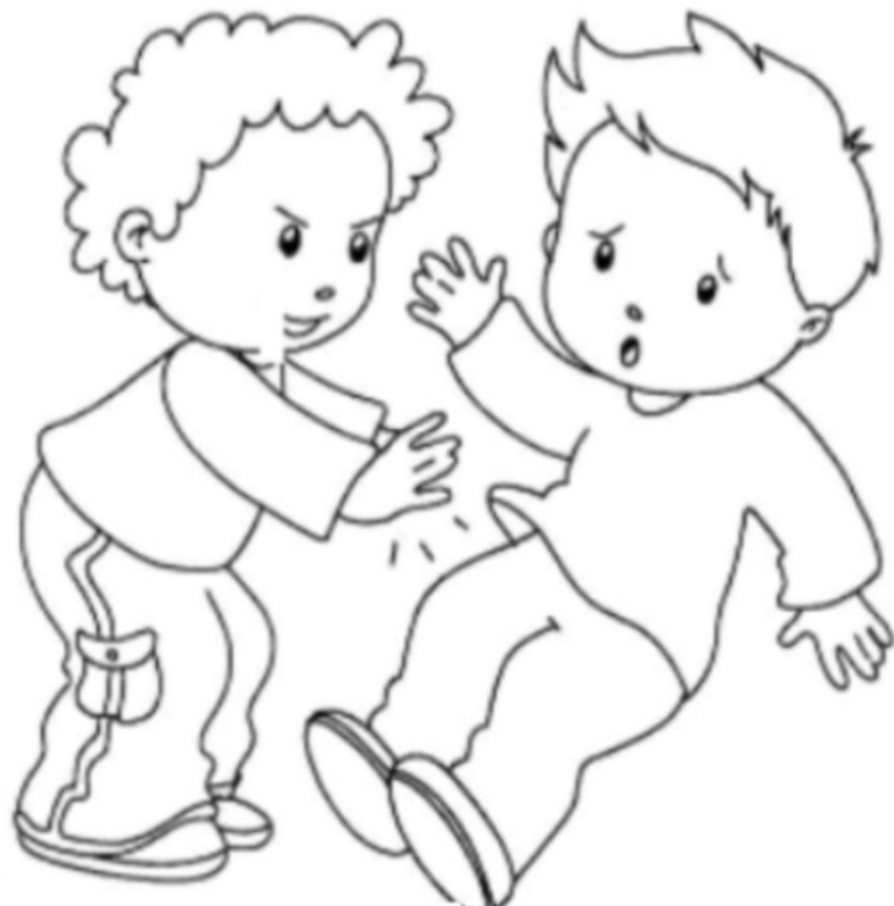
BAMBINI CHE SI SPINGONO

ATTIVITA' :INDIVIDUA L'AZIONE CORRETTA TRA QUELLE CHE VEDI NEL DISEGNO E MOTIVA LA TUA SCELTA. COLORA.