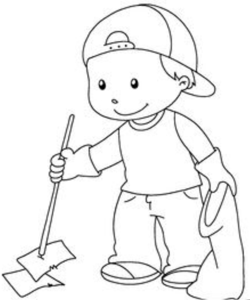
BAMBINO CHE RACCOGLIE CARTACCE