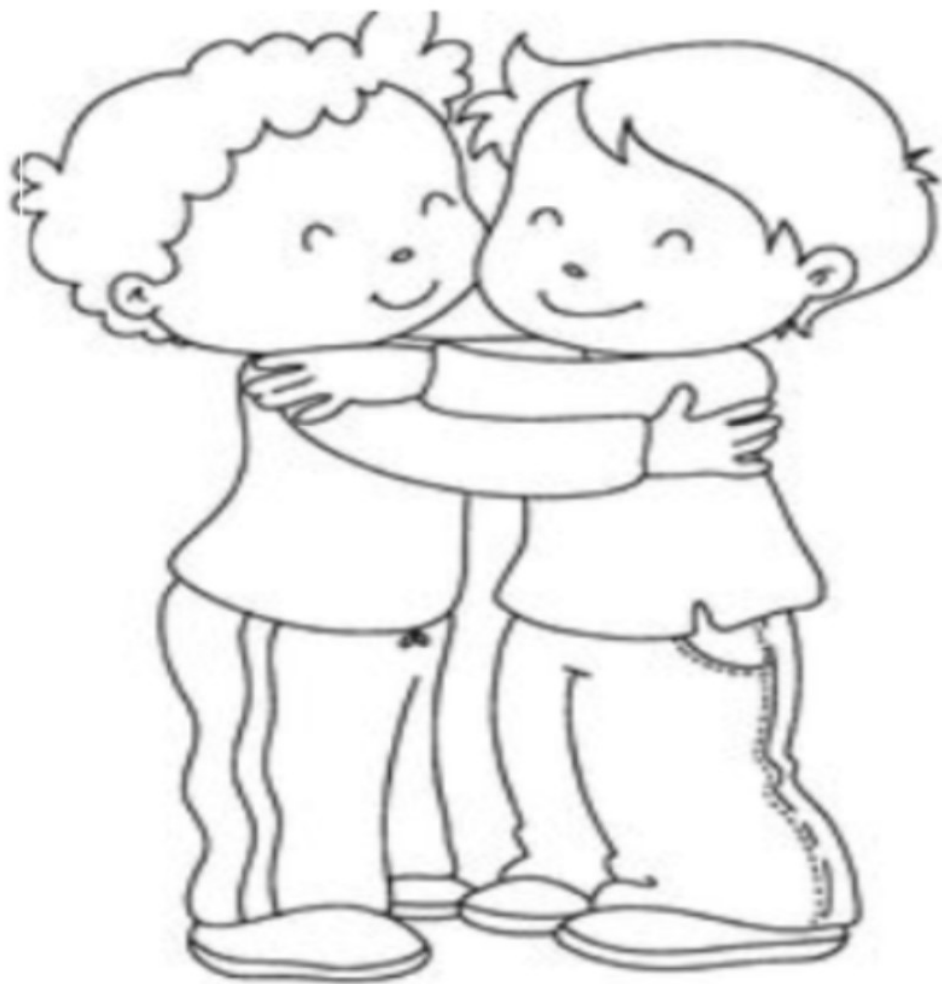
BAMBINI CHE SI ABBRACCIANO