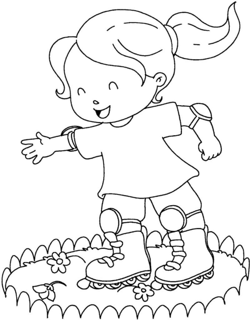
BAMBINA CHE PATTINA NELL'AIUOLA