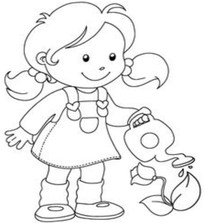
BAMBINA CHE ANNAFFIA I FIORI

ATTIVITA': INDIVIDUA L'AZIONE CORRETTA TRA QUELLE CHE VEDI NEL DISEGNO E MOTIVA LA TUA SCELTA . COLORA